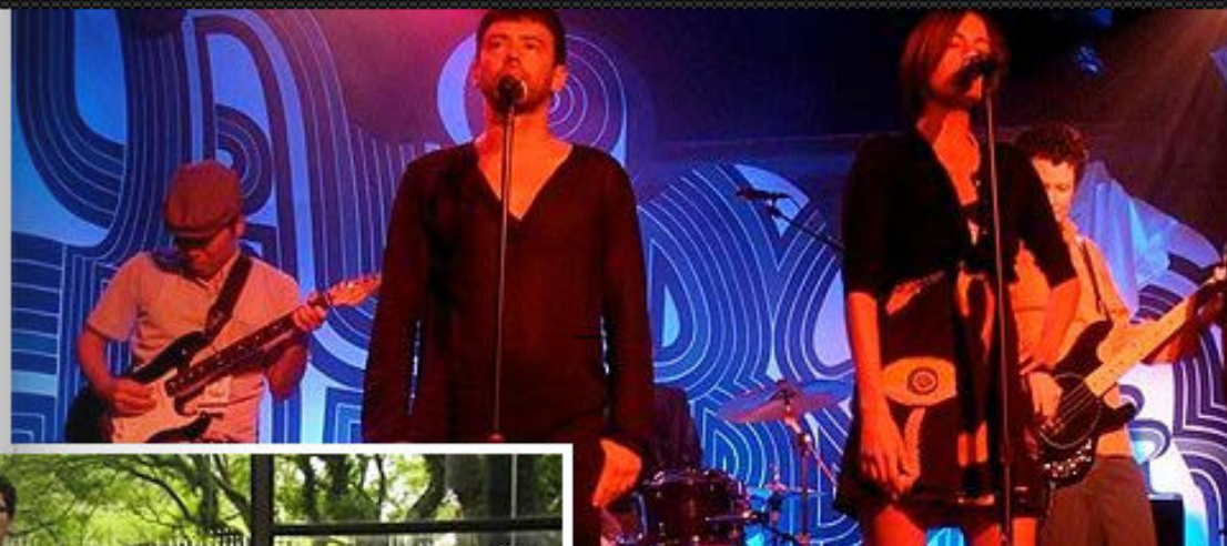
Los Super Elegantes - Grupo criado em San Francisco, EUA, em 1995. Baseado em Los Angeles. Realizam performances musicais.

O térreo do edifício foi transformado em uma grande praça pública com apresentações de música, dança, performances, cinema, para que a mostra se consolide como espaço social, gerador de energia criativa que contagia tanto artistas quanto o público.