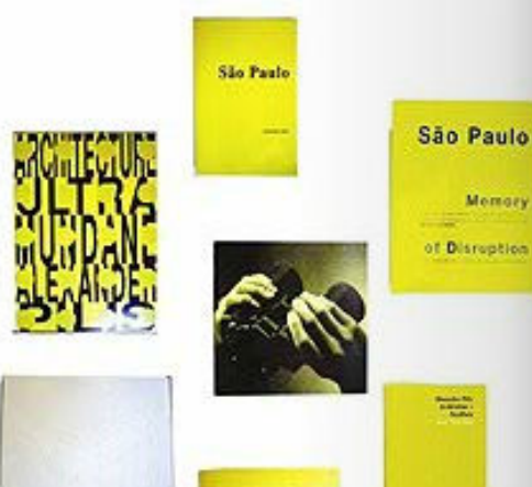
Alexander Pilis nasceu no Rio de Janeiro e vive em Barcelona. Sua obra é uma construção arquitetônica e se intitula "Arquitetura Parallaxe (desaparecer-aparecer)" . É composta por madeirite, rodas com rolimã, imagens e textos, vídeo, objetos, publicação e palestras-debate.