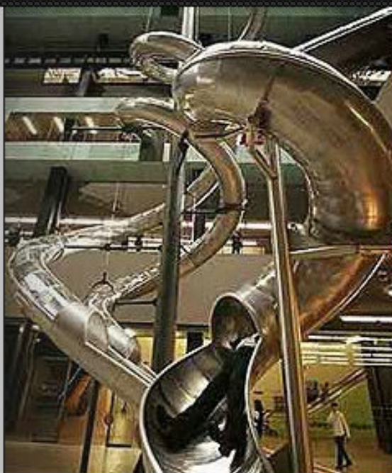
Carsten Höller nasce na Bélgica em 1961 e vive em Estocolmo, na Suécia. Instalou dois escorregadores da série "Test Site" , semelhantes aos que estão na Tate Modern, em Londres e na Prada de Milão. Ele se interessa pelo espetáculo das pessoas observando outras escorregando, e pela experiência de prazer e ansiedade daqueles que escorregam.

No entanto, a atitude dos curadores que gerou maior polêmica foi a de deixar vazio o segundo andar do prédio, projetado por Oscar Niemeyer. Por isto, a imprensa apelidou esta edição de "Bienal do Vazio". O visitante tem a experiência do prédio assim como foi concebido, em "planta livre". Este termo refere-se ao conceito criado em 1926 pelo arquiteto suíço-francês Le Corbusier para definir a área em que o uso de pilotis e de concreto armado permitem deixar de usar paredes para sustentar os andares de um edifício.