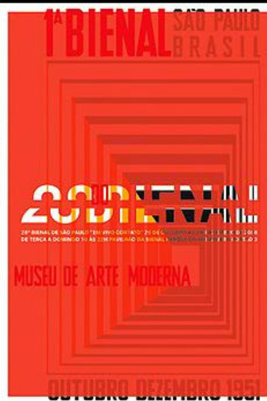
Cartaz da 28ª Bienal Internacional de São Paulo

No entanto, a atitude dos curadores que gerou maior polêmica foi a de deixar vazio o segundo andar do prédio, projetado por Oscar Niemeyer. Por isto, a imprensa apelidou esta edição de "Bienal do Vazio". O visitante tem a experiência do prédio assim como foi concebido, em "planta livre". Este termo refere-se ao conceito criado em 1926 pelo arquiteto suíço-francês Le Corbusier para definir a área em que o uso de pilotis e de concreto armado permitem deixar de usar paredes para sustentar os andares de um edifício.